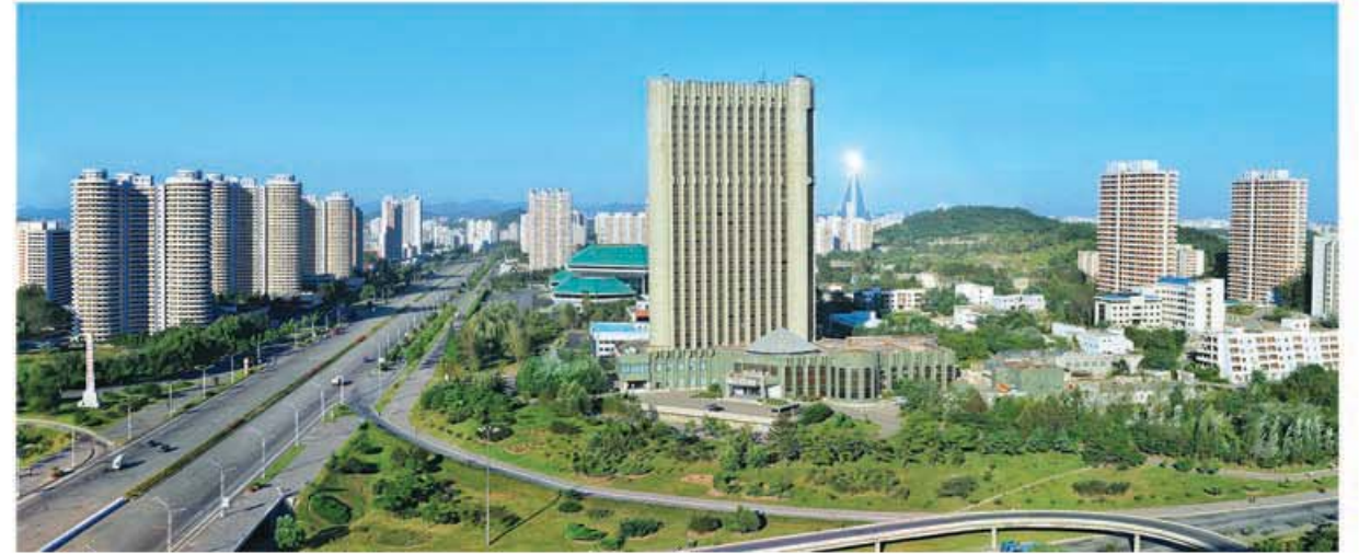
주체78(1989)년에 건설된 광복거리의 일부

그러자 그이께서는 집주인의 말을 긍정해주시며 아주머니가 참 좋은 의견을 제기했다고, 인민들이 좋다면 다 좋은것이라고 하시며 앞으로 모든 다층주택들에 온돌을 놓아주도록 하겠다고 하시였다. 그리고도 마음이 놓이지 않으시여 친히 권칙을 드시고 방의 길이와 너비를 재여보신 그이께서는 방안이 길다고, 편리하게 적당히 막아주라고 하시였고 부엌에 가시여서는 가시대와 찬장에 있는 그릇들과 쌀독 등을 일일이 보신 다