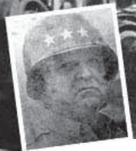
황천객이 된 워커