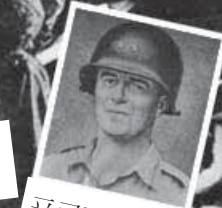
포로가 된 뎀