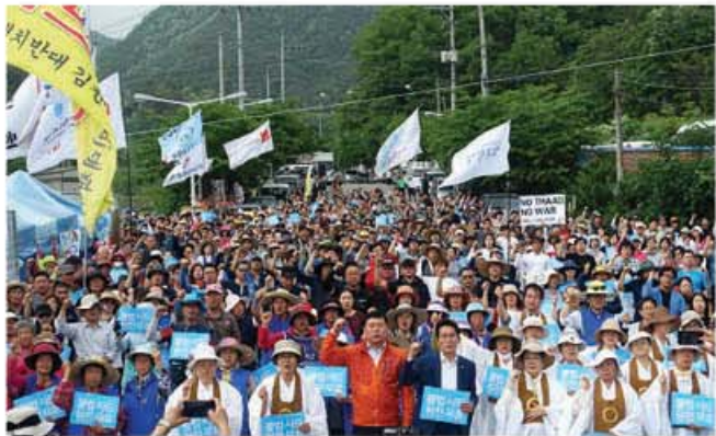
미국과 괴뢰당국의 《싸드》배치강행을 반대하여 투쟁하는 남조선인민들

트럼프의 오만한 발언이 나가자 남조선은 별동지를 쫓겨놓은 격이 되었다. 남조선의 보수세력들은 긴급고위정책간담회를 연다, 비상대책회의를 한다 하면서 새 미행정부의 정책과 관련한 대비책을 세우겠다고 분주탕을 피워댔다. 한편 《아직 정식 통보받은 것은 없다.》느니, 《기존합의를 지킬 것으로 본다.》느니 하면서 미국으로부터 버림을 받고 궁지에 몰린 이들의 가련한 처지를 가리우고 남조선 각계의 비난여론을 잠재우려고 진땀