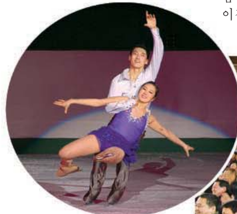
제25차 광명성절경축 백두산상국제회거축전을 관람하는 재중동포들