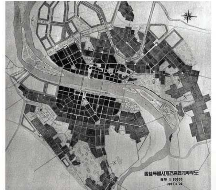
가렬한 전쟁의 불길속에서 작성된 평양시북부건설총계획도

위대한 수령님께서서는 한장의 종이우에 힘있게 연필을 그어나가시였다. 잠시후 종이우에는 평양시의 룬곽이 형성되였다. 한동안 놀라움을 금치 못해하는 일군을 바라보시던 그이께서는 일제통치시기 비문화적으로, 기형적으로 건설되였던 평양시가 전쟁으로 형체마저 남지 않았다고 하시며 우리는 보란듯이 평양을 세계적인 대도시로 일떠세워야 한다고, 여기서 중심은 인민을 위한 교통망과 주택, 문화시설을 현대적으로 건설하는데 두며 도시의 중심부에 광장을 만들고 모란봉과 대동강을 따라 대동로를 내고 대동강에는 다리를 건설하는 등 형성방향에 대해서 일일