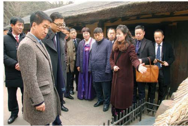
만경대고향집을 돌아보는 중국조선족기업가협회 대표단

시하였으며 위대한 수령님께서 탄생하시어 어린시절을 보내신 만경대고향집도 깊은 감동속에 돌아보았다.