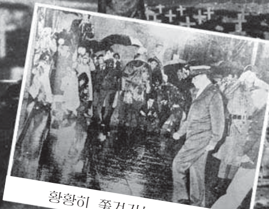
황황히 쫓겨가는 백아더