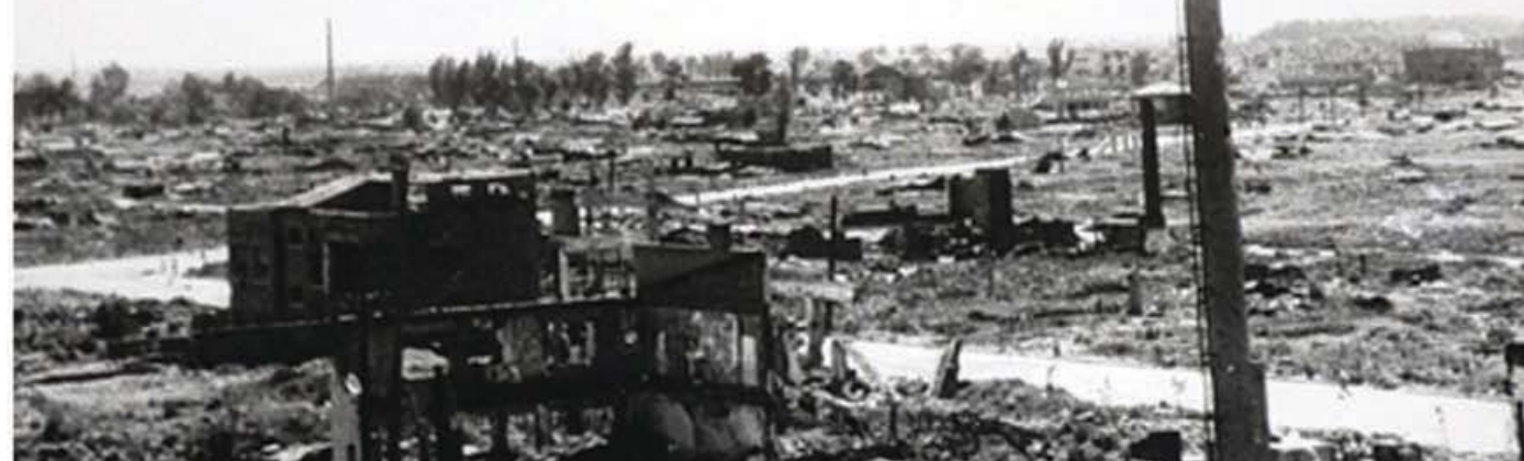
3년간의 전쟁으로 재더미만 남은 평양시의 일부