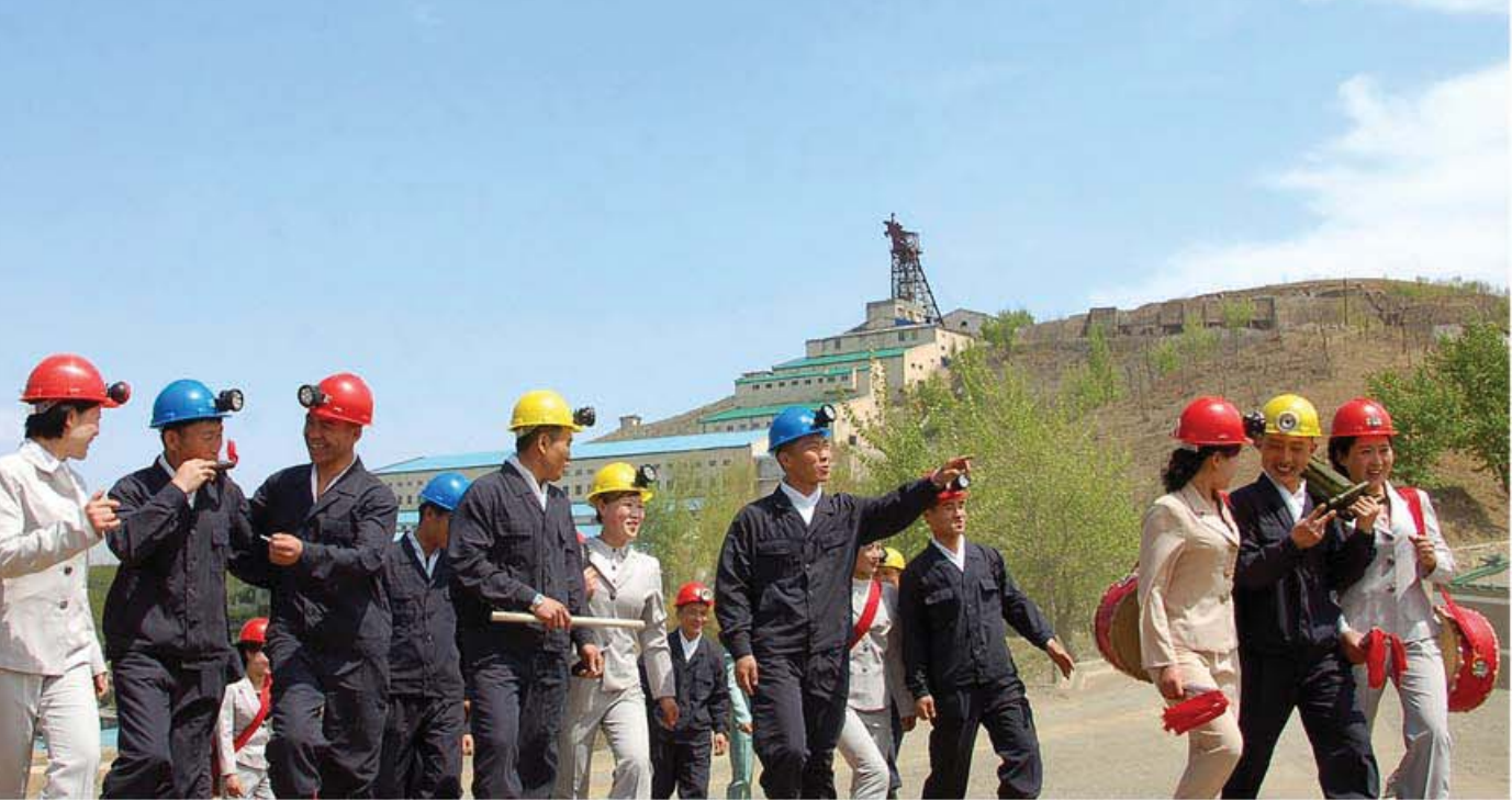
- 만리마의 고삐를 틀어쥐고 -