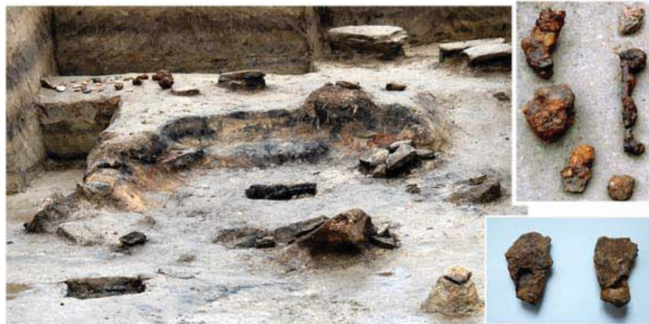
글 본사기자 최기철

새로 발굴된 조선후국의 소금생산유적은 오늘 민족유산의 보물고고를 보다 풍부히 하고있으며 온 겨레에게 크나큰 민족적공지와 자부심을 안겨주고 있다.