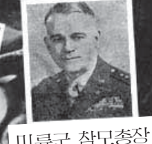
미육군 참모총장 클린즈