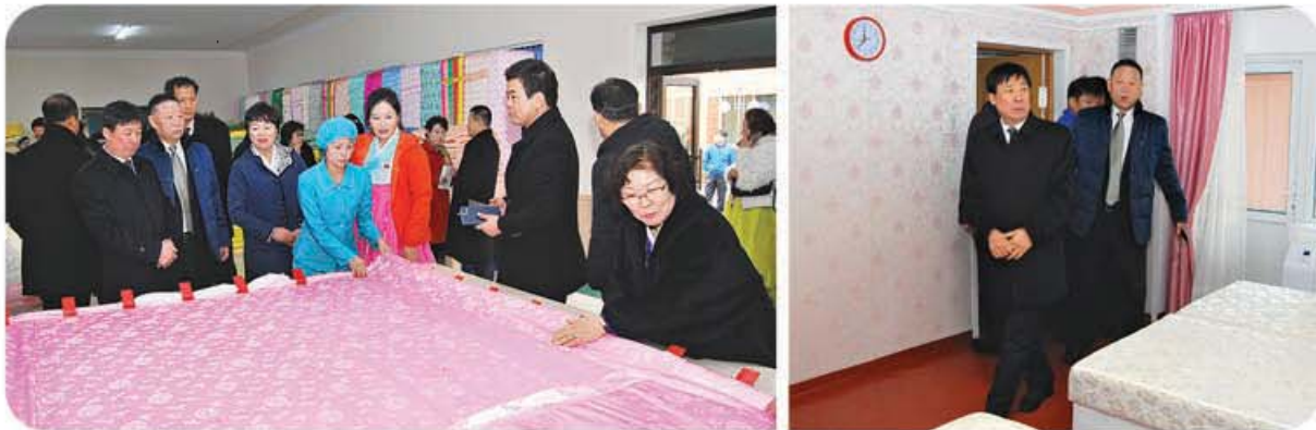
김정숙평양제사공장을 참관하는 재중동포들

흠모의 마음을 안고 그들은 위대한 수령님께서 영생의 모습으로 계시는 금수산태양궁전을 찾아 숭고한 경의를 표