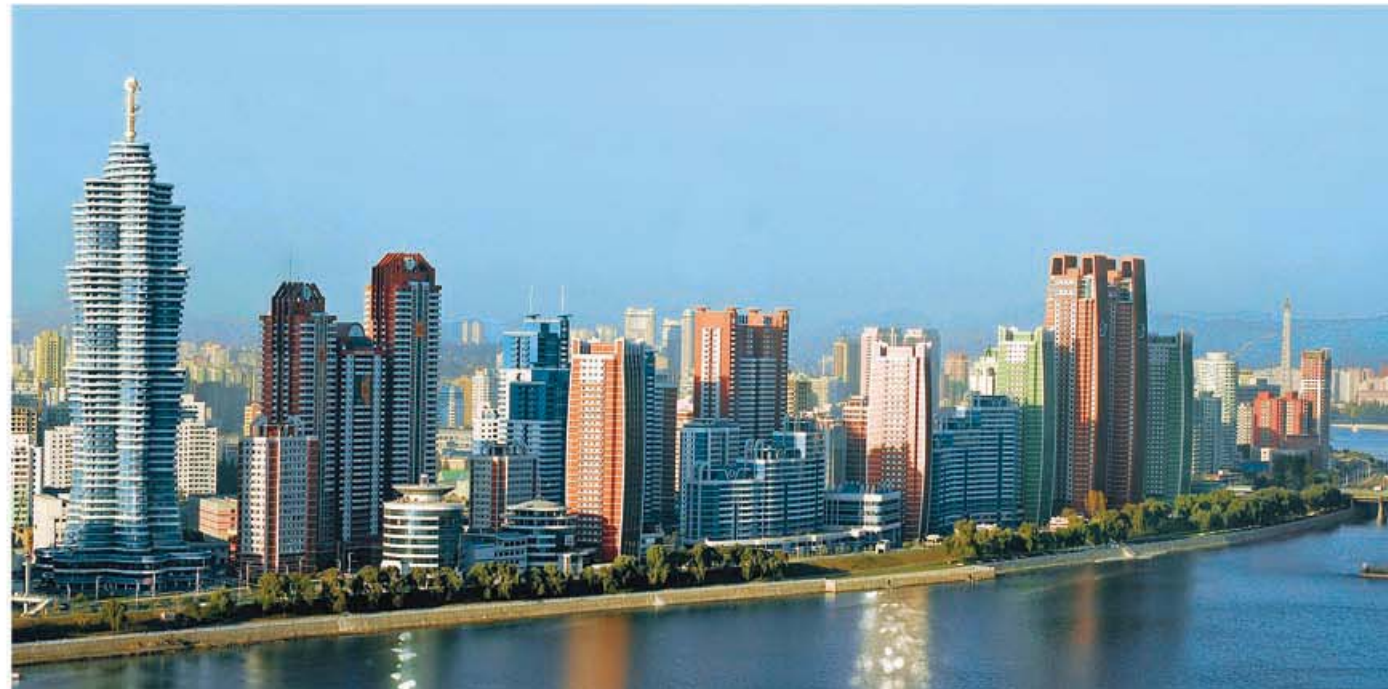
웅장화려하게 일떠선 미래과학자거리

당시 조국인민들은 조국과 인민을 위하여 불멸의 업적을 쌓아올리시였으며 특히 수도 평양을 인민의 도시로, 락원으로 전변시키기 위해 바치신 위대한 수령님의 업적을 빛내여가려는 충정의 마음을 안고있었다. 이러한 인민의 요구를 그대로 구현하시여 위대한 장군님께서서는 평양의