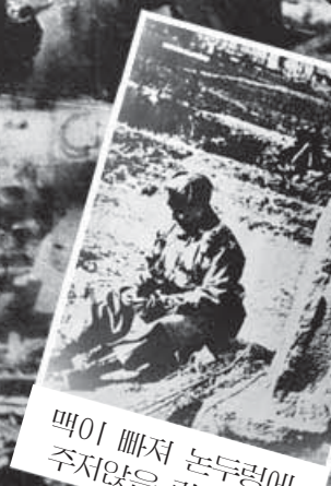
백이 빠져 놔두렁에 주지않은 릿지웨이