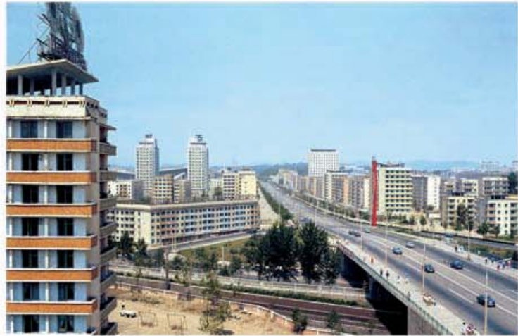
조선로동당 제5차대회를 맞으며 건설된 천리마거리 주체68(1979)년 촬영

되니 더 말씀드릴 여지가 없다고 대답을 드리였다. 이윽고 마루바닥이 차지 않는가 손을 대보시던 위대한 수령님께서서는 이번에는 온돌방보다는 어떤가고 다시 물어주시였다.