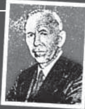
미국무장관 마 샬

신화는 깨어지고 말았다. 우리는 남들이 생각하던 것처럼 그렇게 강대한 나라가 아니었다.