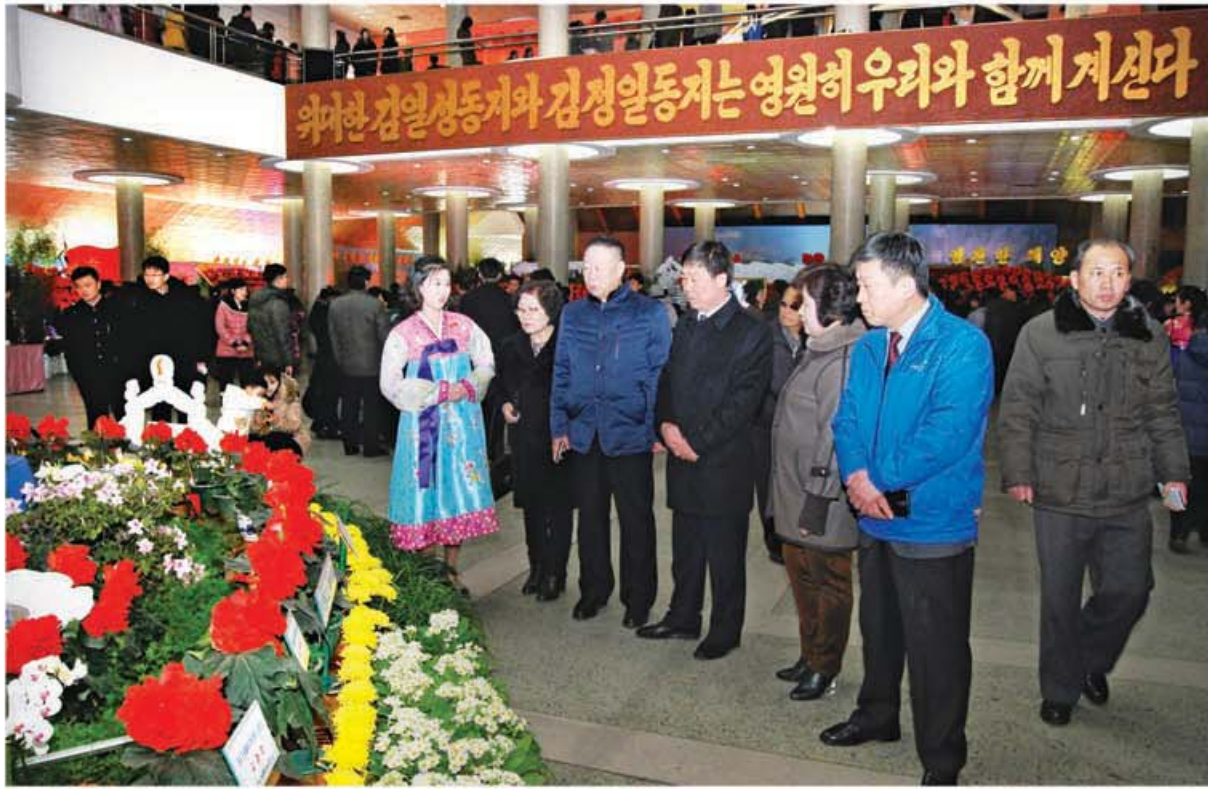
제21차 김정일화축전장을 돌아보는 재중조선인총련합회축하단