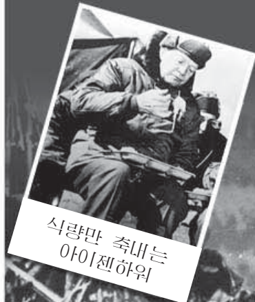
식량만 축대는 아이젠하워