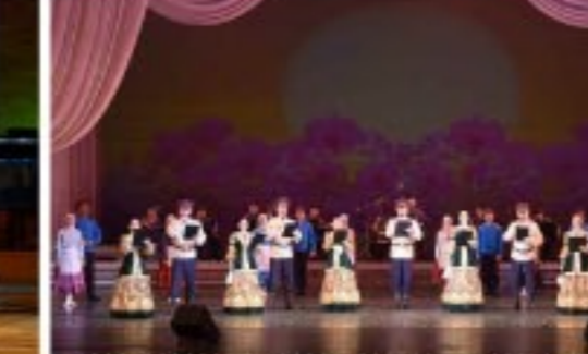
로씨야 벨라루스 스페터 쟈자크예술단의 합창 《희영아래 사파바다》 《그리움은 끝이 없네》