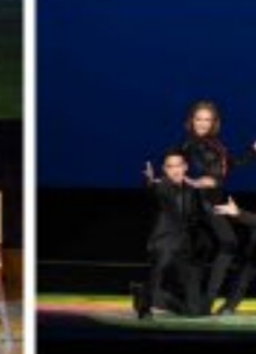
로씨야와 벨라루스의 교예배우들은 《공중풍물놀이》와 《전북조형》에서 독특하고 세련있는 기교를 유연하면서도 원활하게 수행하여 관중들의 경탄을 자아냈다.