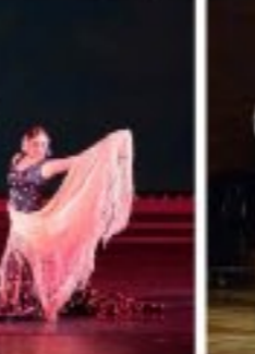
라이요슬단의 기능 및 환상예술 《마마다와 라이 젊은이들》