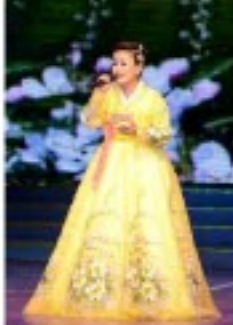
국제교려인물일련행도 예술단 성악가의 노래 《희영아래 사파바다》 《그리움은 끝이 없네》

《전북조형》에서 독특하고 세련있는 기교를 유연하면서도 원활하게 수행하여 관중들의 경탄을 자아냈다. 기발한 착상과 능숙한 교감으로 사람들을 황홀하고 신비로운 세계로 이끌어가는 요술작품들은 관람자들의 인기를 끌었다. 공연들은 인류공동의 정사스러운 명절인 태양절을 맞이하는 혁명의 수도 평양의 분위기를 더욱 이채롭게 하고 위대한 당의 명도덕과 사회주의강국건설의 모든 전선에서 새로운 승리를 쟁취하기 위한 혁명적인 총공세를 벌리고있는 우리 인민에게 고무적임을 알려주었다. 공연은 계속된다. 【조선중앙통신】