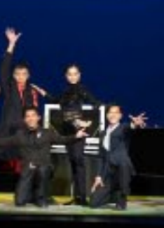
로씨야와 벨라루스의 교예배우들은 《공중풍물놀이》와 《전북조형》에서 독특하고 세련있는 기교를 유연하면서도 원활하게 수행하여 관중들의 경탄을 자아냈다.

5 면 에서 계속 그들은 화학공업부문에서 주체비담론과 비료, 어미까지 화학제품생산을 높여나간다는 단호한 결정을 내린 단결심과 불굴의 투쟁을 보여 주었다. 석탄공업부문과 단철기구 생산, 공작, 기업소들에서 혁신의 동력을 높이 올려야 할것이라고 말하였다. 혁신기제인합기업소, 대인종기제인합기업소, 금성프락트보공정, 승리자동차공업소 일군들과 노동계급이 현대화를 다그치고 세형의 프락트보공정기제, 다용도화된 농기계들의 개발생산공정을 완비하며 성능 높은 기계설비들을 더 많이 개발생산함에 대하여 그들은 강조하였다. 그들은 인민생활향상을 전 환을 일으키는 데 대한 의의와 불 타르고 경공업발달과 지방공업발달에서 결정적역할을 바 로세워 생산을 활성화하며 국제 원료와 자재로 다양하고 질 높은 인민소비품들을 평평 생산함에 대하여 언급하였다. 전사회적으로 도덕적상을 바로 세우고 사회주의생활양식을 확립