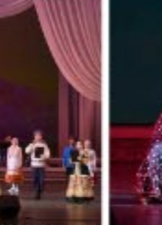
에스빠냐 플라멩코민속음악단의 무용 《희망의 춤》